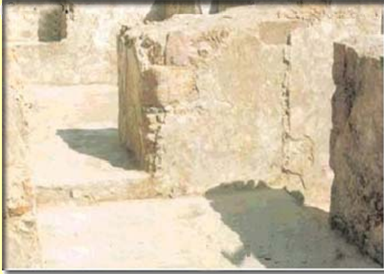
دەرگای چونه ژۆردۆدی ژۆردۆکی پیقه مپهر سهلامی خۆای لهسهر